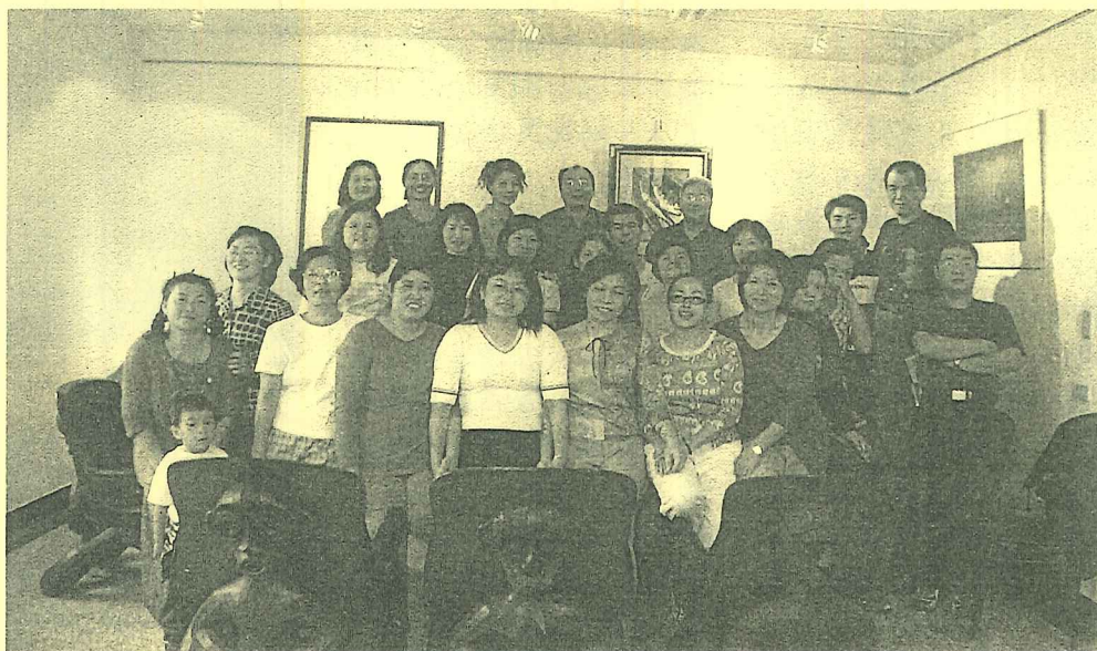
永續就業工程熱情有勁的八里工作團隊

90年10月27日將是三大就業工程正式開始的日子，無疑也將是北海岸藝文、生態展現新姿態的佳期，未來九個月裡，250位成員將創造出無窮的新希望。