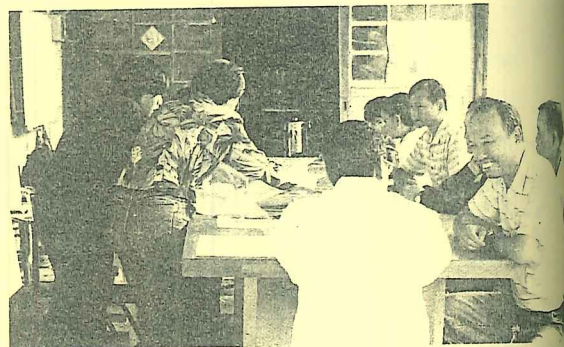
永續就業工程喚起在地的居民來做社區營造工作

三大就業工程最重要的一個特色，便是透過現代科技，將計劃執行過程中實地訪查的資料，建構